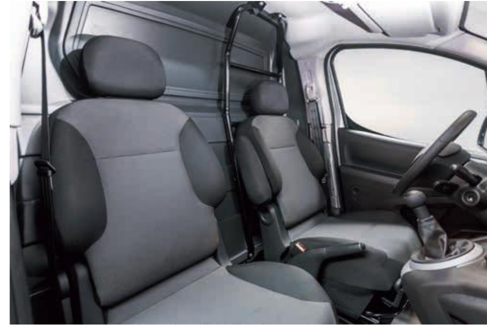
Тканевая обивка Tissu Mica Grey