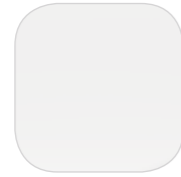
Белый ICY WHITE акрил