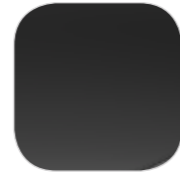
Черный NOIR PERLA металлик