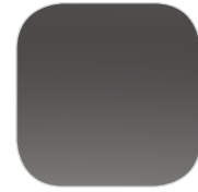
Серый GRIS SHARK металлик