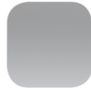
Серебристый GRIS ALUMINIUM металлик